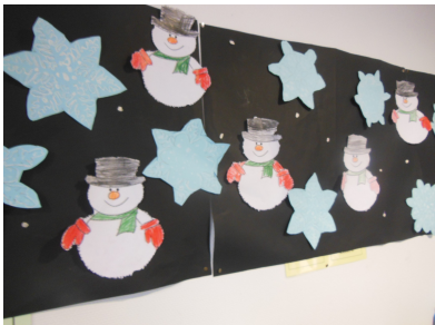
Bonhommes de neige et flocons