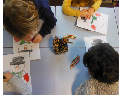
Bonhommes de neige