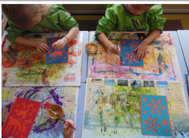
Les pochoirs sur l'hiver

Nous avons réalisé une carte de vœux pour souhaiter une bonne année à chaque famille.