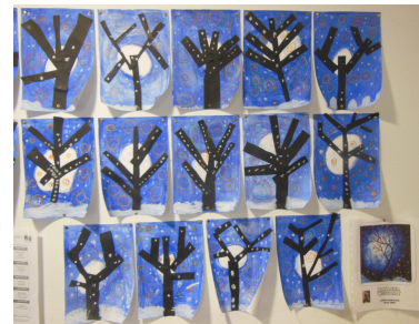
Paysages en hiver

Nous lisons des histoires sur l'hiver et le froid et apprenons des mots sur l'hiver.