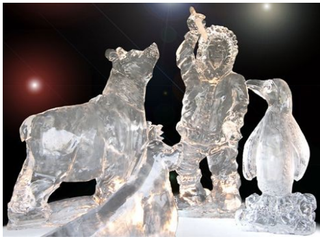
Sculpteur sur glace

Par ailleurs, nous avons découvert un nouvel artiste peintre et des réalisations en sculpture dans la glace.