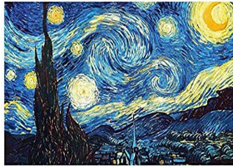
La nuit étoilée de Vincent Van Gogh